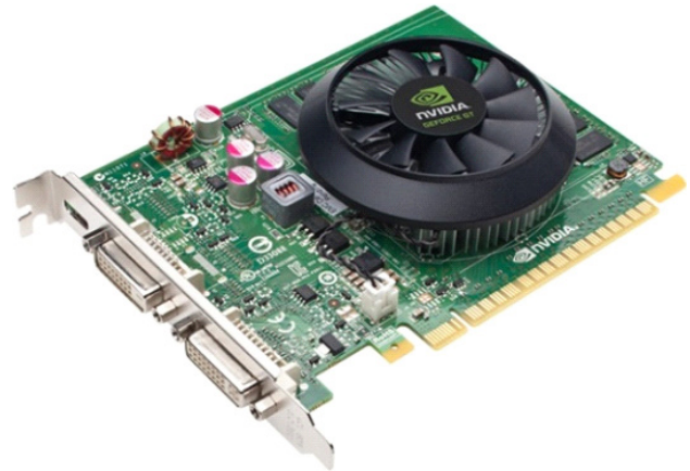
Placa de vídeo 7

Permitem que os resultados numéricos dos cálculos de um processador sejam traduzidos em imagens e gráficos para aparecer em um monitor.