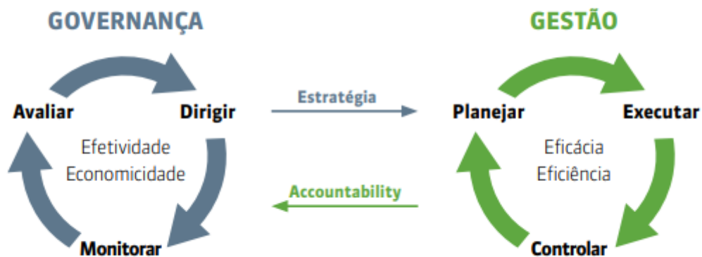
Figura 1. Relação entre governança e gestão.