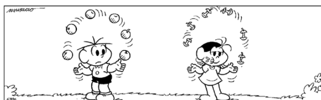
Copyright ©1999 Mauricio de Sousa Produções Ltda. Todos os direitos reservados.