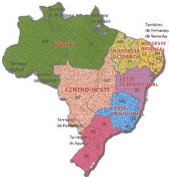
Divisão regional de 1945

Conforme a divisão regional de 1945, o Brasil possuía sete regiões: Norte, Nordeste Ocidental, Nordeste Oriental, Centro-Oeste, Leste Setentrional, Leste Meridional e Sul. Na porção norte do Amazonas foi criado o território de Rio Branco, atual estado de Roraima; no norte do Pará foi criado o estado do Amapá. Mato Grosso perdeu uma porção a noroeste (batizado como território de Guaporé) e outra ao sul (chamado território de Ponta Porã). No Sul, Paraná e Santa Catarina foram cortados a oeste e o território de Iguazu foi criado.