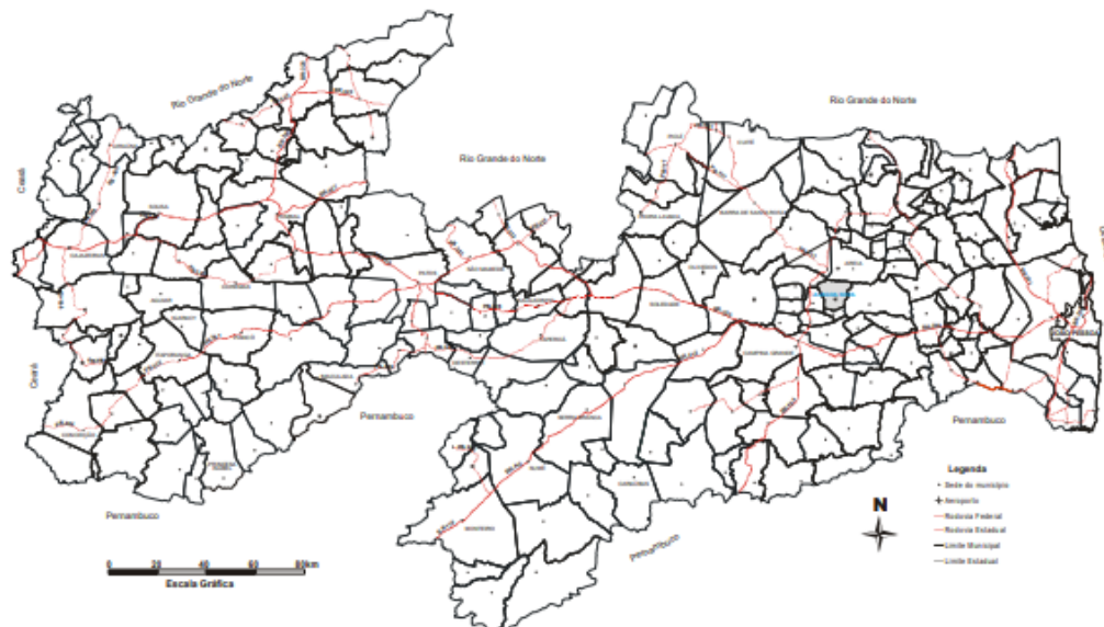
Figura 2 – Mapa de acesso rodoviário

O município de Alagoa Nova está localizado na Microrregião Alagoa Nova e na Mesorregião Agreste Paraibano do Estado da Paraíba. Sua Área é de 122 km 2 representando 0.2166% do Estado, 0.0079% da Região e 0.0014% de todo o território brasileiro. A sede do município tem uma altitude aproximada de 530 metros distando 98,8123 Km da capital. O acesso é feito, a partir de João Pessoa, pelas rodovias BR 239/BR 104/PB 097