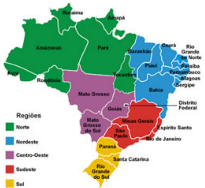
Divisão regional atual

Em 1970, o Brasil ganhou o desenho regional atual. Nasceu o Sudeste, com São Paulo e Rio de Janeiro sendo agrupados a Minas Gerais e Espírito Santo. O Nordeste recebeu Bahia e Sergipe. Todo o território de Goiás, ainda não dividido, pertencia ao Centro-Oeste. Mato Grosso foi dividido alguns anos depois, dando origem ao estado de Mato Grosso do Sul.