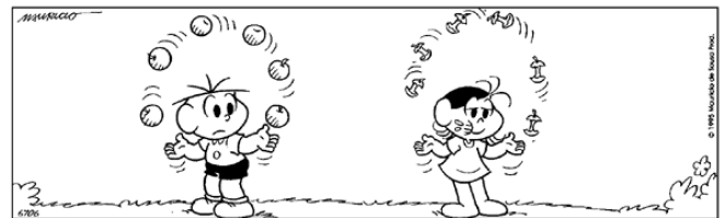
Copyright ©1999 Mauricio de Sousa Produções Ltda. Todos os direitos reservados.