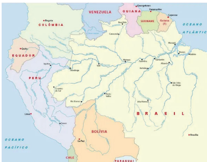
Bacia do Rio Amazonas

Os principais rios e afluentes que compõem a Bacia Amazônica são: Rio Madeiras, Rio Xingu, Rio Trombetas, Rio Branco, Rio Purus, Rio Tapajós, Rio Içá, Rio Japurá, Rio Jari, Rio Javari, Rio Tarauacá, Rio Itacuaí e Rio Iriri.