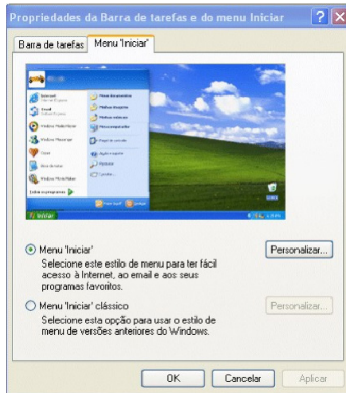
Propriedades de Barra de tarefas e do Menu Iniciar.