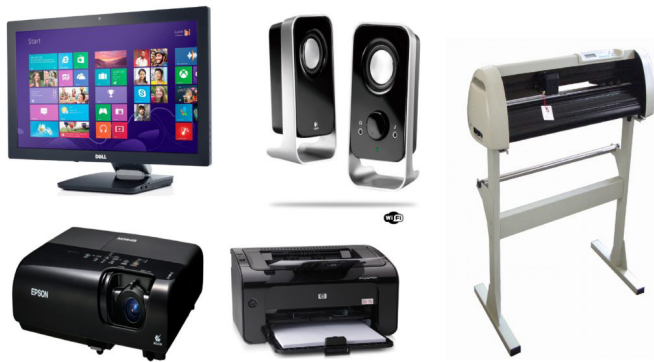
Periféricos de saída.