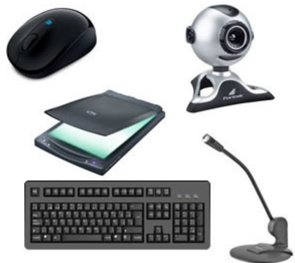
Periféricos de entrada.

– Periféricos de entrada: são aqueles que enviam informações para o computador. Ex.: teclado, mouse, scanner, microfone, etc.