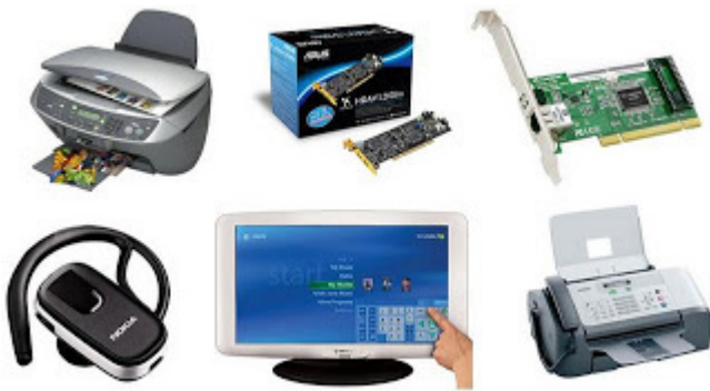
Periféricos de entrada e saída.

– Periféricos de entrada e saída: são aqueles que enviam e recebem informações para/do computador. Ex.: monitor touchscreen, drive de CD – DVD, HD externo, pen drive, impressora multifuncional, etc.