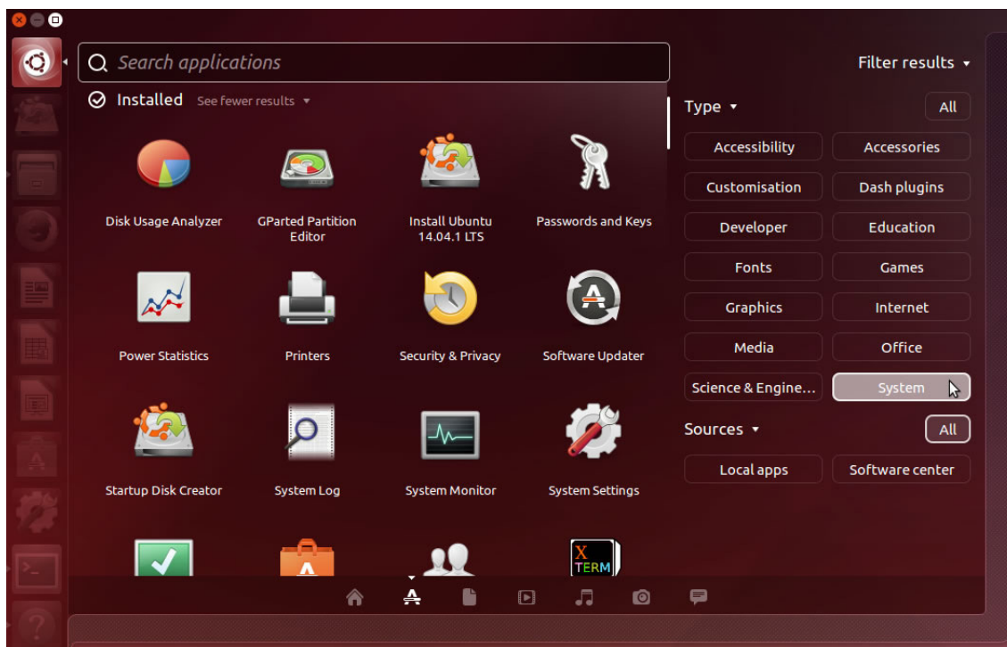
Ubuntu com a interface Unity.

• Interface gráfica (GUI): conhecida também como gerenciador de desktop/área de trabalho, é a forma mais recente de o usuário interagir com o sistema operacional. A interação é feita por meio de janelas, ícones, botões, menus e utilizando o famoso mouse. O Linux possui inúmeras interfaces gráficas, sendo as mais usadas: Unity, Gnome, KDE, XFCE, LXDE, Cinnamon, Mate etc.