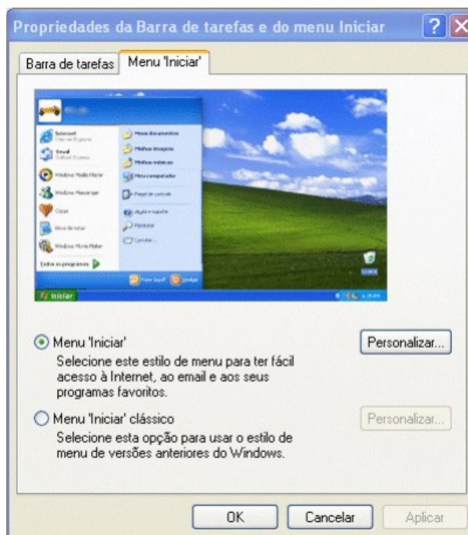
Propriedades de Barra de tarefas e do Menu Iniciar.