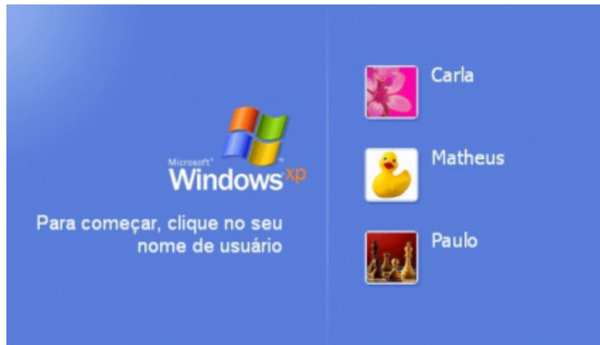
Tela de Logon.

Ao iniciar o Windows XP a primeira tela que temos é tela de logon, nela, selecionamos o usuário que irá utilizar o computador 1 .