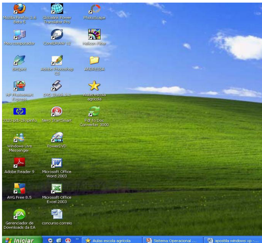
Área de trabalho do Windows XP.

Na Área de trabalho encontramos os seguintes itens: