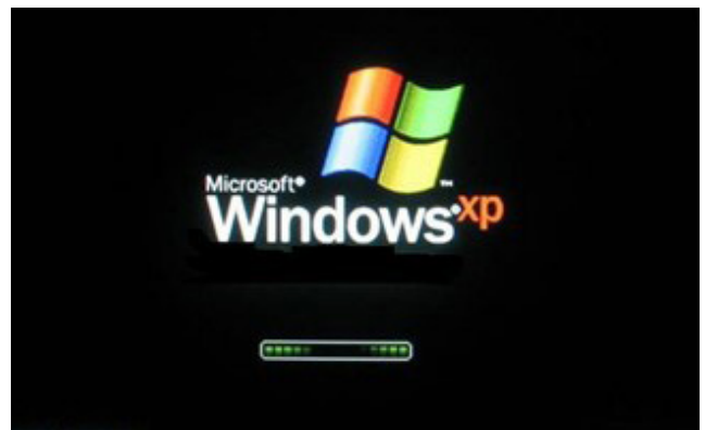
Inicialização do Windows XP.

O XP embute uma porção de acessórios muito úteis como: editor de textos, programas para desenho, programas de entretenimento (jogos, música e vídeos), acesso à internet e gerenciamento de arquivos.