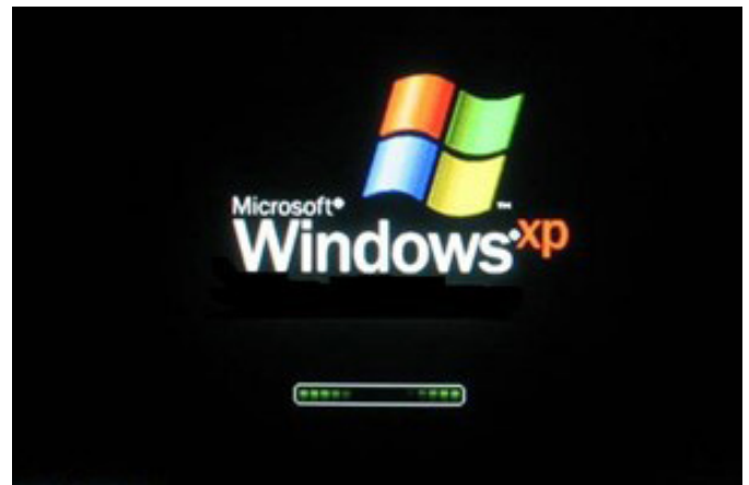
Inicialização do Windows XP.

O XP embute uma porção de acessórios muito úteis como: editor de textos, programas para desenho, programas de entretenimento (jogos, música e vídeos), acesso à internet e gerenciamento de arquivos.