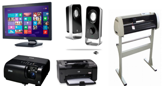
Periféricos de saída. 9

– Periféricos de saída: São aqueles que recebem informações do computador. Ex.: monitor, impressora, caixas de som.