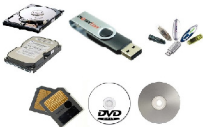
Periféricos de armazenamento. 11

– Periféricos de armazenamento: são aqueles que armazenam informações. Ex.: pen drive, cartão de memória, HD externo, etc.