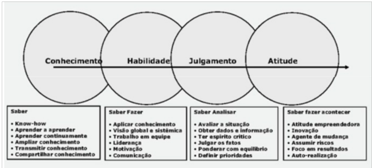
Figura – As competências essenciais do administrador, segundo Chiavenato

Assim, o administrador deve ocupar diversas posições estratégicas nas organizações e desenvolver papéis essenciais à sustentabilidade e crescimento dos negócios.