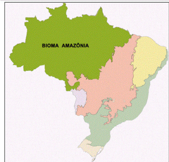
Localização do bioma Amazônia, segundo o Instituto Brasileiro de Geografia e Estatística.

Segundo o Instituto do Homem e Meio Ambiente da Amazônia (Imazon), o desmatamento no bioma aumentou cerca de 40% entre os anos de 2017 e 2018, perdendo-se quase 4.000 km 2 de mata nativa. A ocorrência do desmatamento deu-se, principalmente, em áreas privadas, assentamentos e unidades de conservação