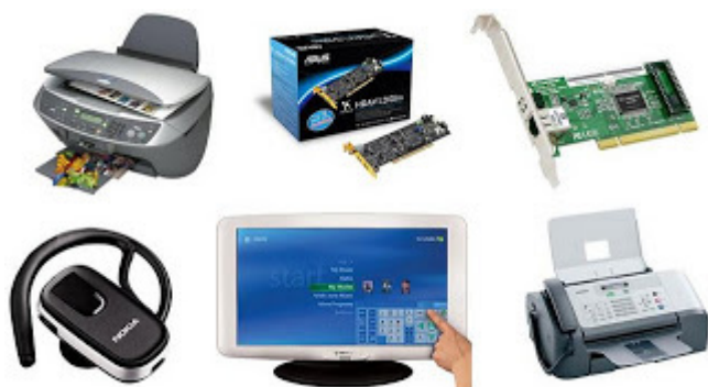
Periféricos de entrada e saída.

– Periféricos de entrada e saída: são aqueles que enviam e recebem informações para/do computador. Ex.: monitor touchscreen, drive de CD – DVD, HD externo, pen drive, impressora multifuncional, etc.