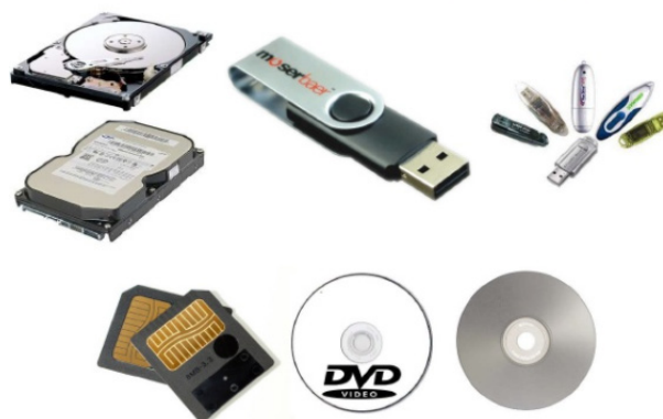
Periféricos de armazenamento.

– Periféricos de armazenamento: são aqueles que armazenam informações. Ex.: pen drive, cartão de memória, HD externo, etc.