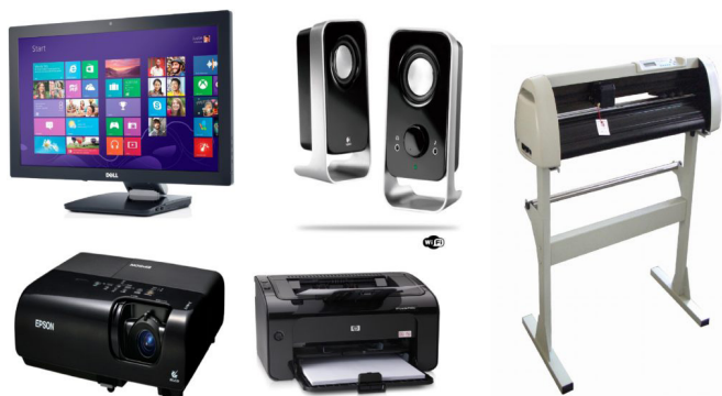
Periféricos de saída.

– Periféricos de saída: São aqueles que recebem informações do computador. Ex.: monitor, impressora, caixas de som.