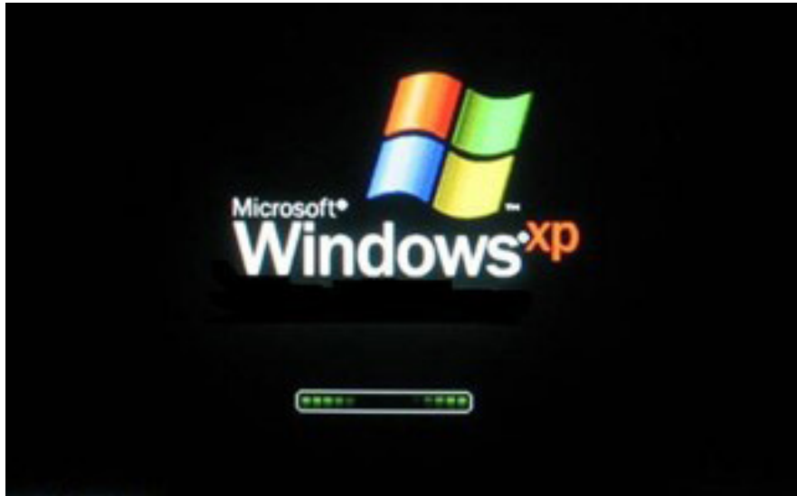
Inicialização do Windows XP.

O XP embute uma porção de acessórios muito úteis como: editor de textos, programas para desenho, programas de entretenimento (jogos, música e vídeos), acesso à internet e gerenciamento de arquivos.