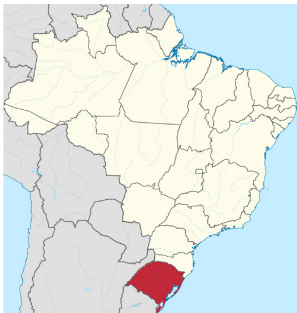
Rio Grande do Sul no mapa do Brasil