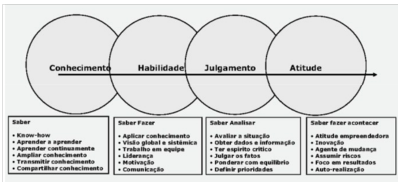
Figura – As competências essenciais do administrador, segundo Chiavenato

Assim, o administrador deve ocupar diversas posições estratégicas nas organizações e desenvolver papéis essenciais à sustentabilidade e crescimento dos negócios.