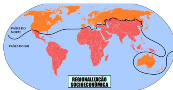
Representação da divisão dos países com base em critérios socioeconômicos

É importante observar que, além de ser muito abrangente, essa forma de regionalização do espaço geográfico mundial possui uma série de limitações. A principal delas é a de não evidenciar a heterogeneidade existente entre os países de um mesmo grupo na classificação. Os países do norte desenvolvido, por exemplo, apresentam-se com as mais diversas perspectivas, havendo aqueles considerados como “potências”, a exemplo dos Estados Unidos, da Alemanha e outros, e aqueles considerados limitados economicamente ou que sofrem crises recentes, tais como Portugal, Grécia, Rússia e Itália.