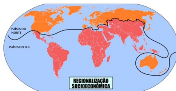
Representação da divisão dos países com base em critérios socioeconômicos

É importante observar que, além de ser muito abrangente, essa forma de regionalização do espaço geográfico mundial possui uma série de limitações. A principal delas é a de não evidenciar a heterogeneidade existente entre os países de um mesmo grupo na classificação. Os países do norte desenvolvido, por exemplo, apresentam-se com as mais diversas perspectivas, havendo aqueles considerados como “potências”, a exemplo dos Estados Unidos, da Alemanha e outros, e aqueles considerados limitados economicamente ou que sofrem crises recentes, tais como Portugal, Grécia, Rússia e Itália.