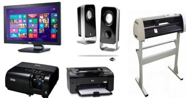
Periféricos de saída. 9

– Periféricos de saída: São aqueles que recebem informações do computador. Ex.: monitor, impressora, caixas de som.