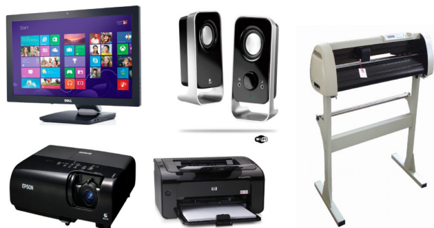
Periféricos de saída. 9

– Periféricos de saída: São aqueles que recebem informações do computador. Ex.: monitor, impressora, caixas de som.