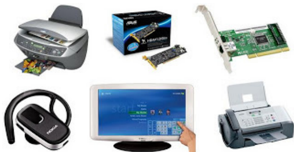
Periféricos de entrada e saída. 10

– Periféricos de entrada e saída: são aqueles que enviam e recebem informações para/do computador. Ex.: monitor touchscreen, drive de CD – DVD, HD externo, pen drive, impressora multifuncional, etc.