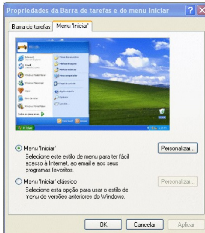
Propriedades de Barra de tarefas e do Menu Iniciar.