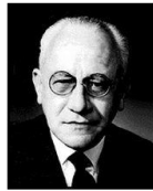
Fernando de Azevedo

Influenciados por esse teórico, teóricos brasileiros propuseram o Manifesto dos Pioneiros da Educação Nova, em 1932.