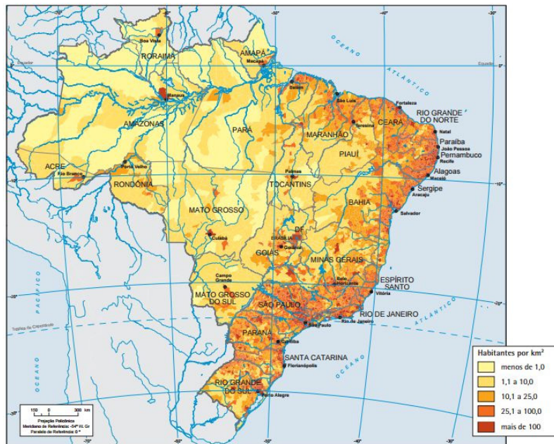
Mapa Demográfico do Brasil