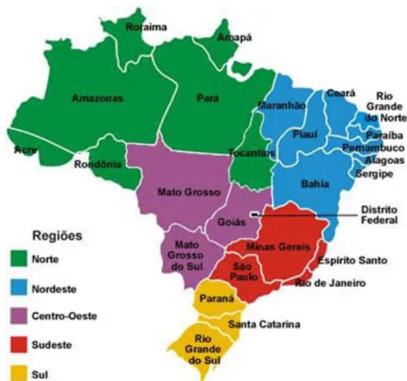
Mapa político que mostra as regiões do Brasil

• Mapa Político: representam as divisões territoriais (fronteiras) entre um espaço delimitado, como cidades, países, continentes, etc