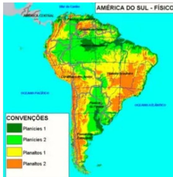
Mapa físico com informações sobre o relevo da América do Sul

• Mapa Físico: apresentam informações sobre os elementos naturais daquele espaço, como a vegetação, o relevo, clima, hidrografia (cursos d'água), entre outros.