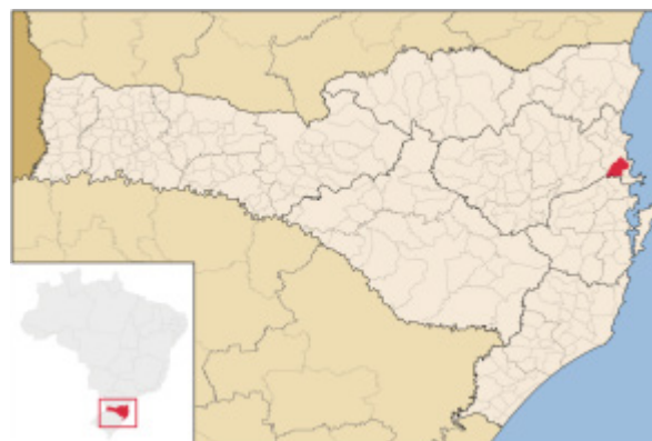
Localização do município no estado

Camboriú está localizada no estado de Santa Catarina, na região Sul do Brasil, situando-se a cerca de 90 quilômetros da capital Florianópolis. Possui coordenadas geográficas aproximadas de 27°01'31" de latitude sul e 48°39'16" de longitude oeste, com altitude média de oito metros acima do nível do mar.