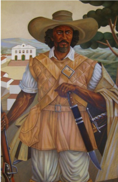
João Gonçalves da Costa 1

A ocupação efetiva do território que viria a se tornar Vitória da Conquista está diretamente associada à atuação de João Gonçalves da Costa. Esse personagem histórico, ligado à expansão territorial portuguesa, teve papel decisivo no processo de desbravamento do Sertão da Ressaca.