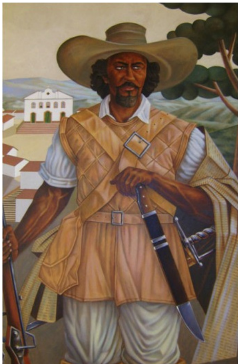
João Gonçalves da Costa 1

A ocupação efetiva do território que viria a se tornar Vitória da Conquista está diretamente associada à atuação de João Gonçalves da Costa. Esse personagem histórico, ligado à expansão territorial portuguesa, teve papel decisivo no processo de desbravamento do Sertão da Ressaca.