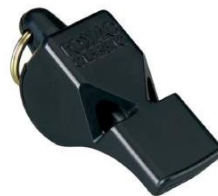
Figura 15 – Apito sem esfera.

Existem vários modelos de apitos disponíveis no mercado, porém recomendam-se apitos fabricados em PVC, ou material similar, que apresentem boa resistência, sobretudo no bocal. Devem oferecer um sibilo constante e forte (acima de 115 decibéis) e preferencialmente não possuir esferas em seu interior.