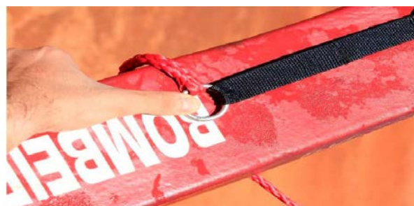
Figura 16 – Acondicionamento do flutuador, passo 1.

Para iniciar o serviço, o Guarda-Vidas deverá acondicionar corretamente o flutuador, deixando-o pronto para ser empregado. Com o polegaresquerdo, segurando a argola distal sobre o corpo do flutuador, deve-se enrolar o cabo em torno do corpo do flutuador (de 2 a 3 voltas). Ao final, deverá inserir o restante do cabo permeado no interior da argola, desenvolvendo até que alcance o mosquetão. O seio do cabo estará fixado ao mosquetão, formando, juntamente com o cinto, uma alça, o que facilitará seu transporte, conforme a figura, e seu desenrolar automático em caso de emergência.