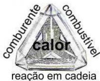
Figura 1- Tetraedro do Fogo

Passemos ao estudo de cada um dos três elementos da combustão e da reação em cadeia.