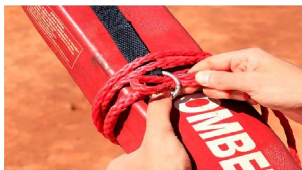
Figura 17 – Acondicionamento do flutuador, passo 2.