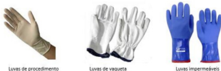
Figura 3.1 – Luvas de proteção

Para a segurança do socorrista, deve-se usar luvas de procedimento para o impedimento de contato com materiais contaminantes, luvas de vaqueta para proteção contra superfícies abrasivas e/ou materiais perfuro-cortantes, e em alguns casos, luvas com um nível de impermeabilização mais elevado para a proteção contra águas poluídas, produtos perigosos, etc.