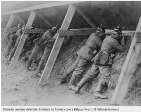
Soldados alemães defendem trincheira na fronteira com a Bélgica

2ª Fase: Foi uma fase de uma guerra mais estratégica em que trincheiras eram construídas com o objetivo de alcançar pontos estratégicos, tais como portos, pontes, etc.