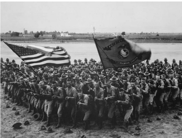
Foto de soldados americanos em material de publicidade de recrutamento

Nesse cenário, os Estados Unidos, que até então era um fornecedor de empréstimos, armas, alimentos e produtos têxteis para a Inglaterra e França, entra na guerra a partir da 2ª fase e define a vitória para a Tríplice Entente.